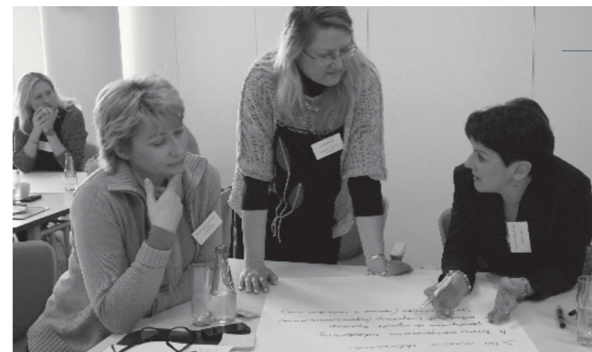
Warsztat pt. „Pracownicy i wolontariusze w fundacjach korporacyjnych”, 7 marca 2014 r.

— Kształtując swoje relacje z otoczeniem, fundacja powinna samodzielnie kontaktować się z interesariuszami. Korzystanie z pośredników typu agencja PR buduje niepotrzebne bariery oraz może powodować nieporozumienia. To fundacja wie najwięcej o swoich działaniach i najrzetelniej potrafi o nich informować. Kontakty bezpośrednie pomagają w budowaniu wiarygodności organizacji.