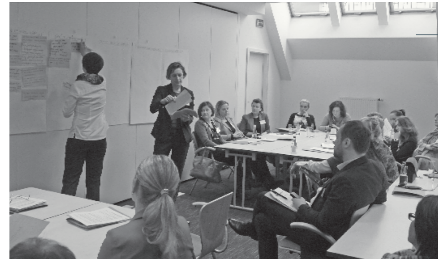
Drugi zjazd uczestników projektu, 13 lutego 2015 r.

Ewaluacja programu zaprojektowana została w odniesieniu do celu programu – było nim stworzenie samodzielnych (a więc z czasem niezależnych od fundacji) centrów aktywności oraz sieci współpracujących ze sobą lokalnych liderów,